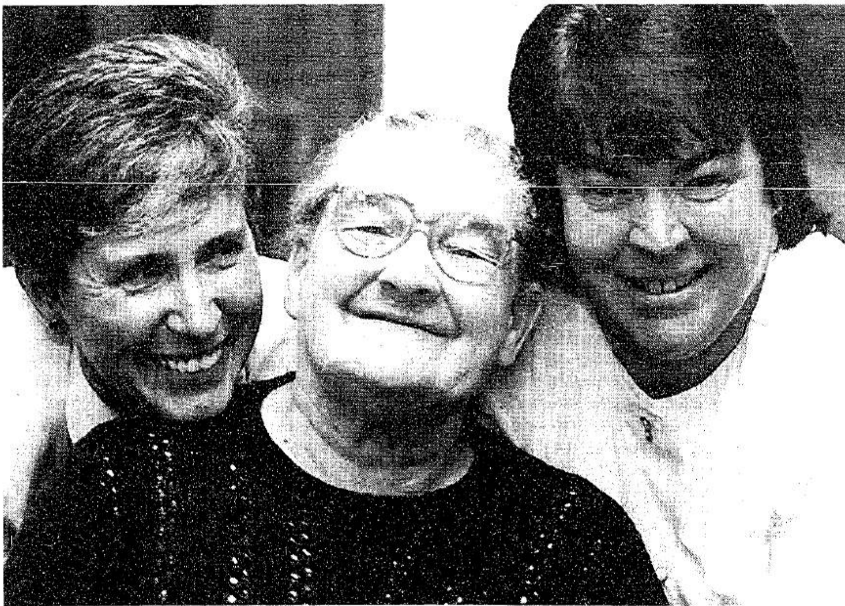
גינה היום, משוחררת לאחר 51 שנה בקרב בנות משפחה